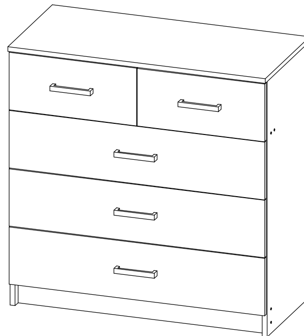
Вега К-04 Комод 5/2 ящ.

Уважаемые покупатели, рекомендуем доверить сборку Вашей мебели профессиональным сборщикам